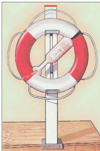
Komplett livboj med bojstolpe.