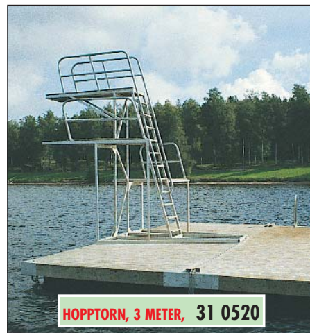
HOPPTORN, 3 METER, 31 0520

Hopptornet tillverkas av rektangulära stålårsprofiler och är varmgalvaniserat. Hoppavsatserna är på 1, 2 och 3 meters höjd med olika uthoppsvinklar för att undvika olycksfall. Alla uthoppsplattformar har en gemensam stege. Hoppavsatserna är beklädda med tryckimpregnerat virke. Alla fotsteg är utförda av trästeg som är fastskruvade med rostfria vagnsbultar. För fraktens skull levereras hopptornet i tre delar för ihopmontering på utläggningsplatsen. Alla monteringsbeslag mot bryggan medföljer och ingår i priset. Hopptornet har en höjd från vattenytan upp till det översta uthoppet c:a 3 meter. Mittuthoppet är en meter lägre och det understa uthoppet är c:a 1,2 meter över vattenytan. Måtten gäller då hopptornet är monterat på sin hopptornsplattform. Skall hopptornet vara friflytande bör våra hopptornsfloattar användas. Dom har kompenserad flytkraft för hopptornets egen tyngd utan snedflytning. Se till att vattendjupet inom tornets hoppzon är det dubbla mot tornets hopp höjd. Kontrollera också att inga befintliga eller glömda föremål finns på sjöns botten.