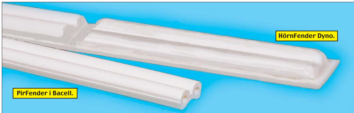
PirFender i Bacell.